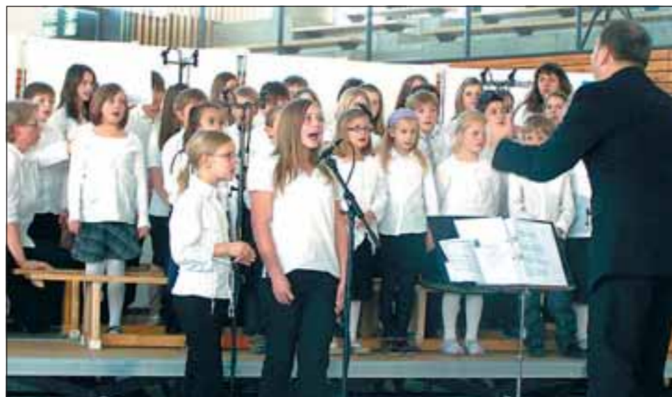
Zum Passionskonzert in Eppingens neuapostolischer Kirche trug auch der 35 Mitglieder zählende Kinderchor dieses Kirchenbezirks bei.

Zur Einstimmung auf die Passionszeit wurde das Leiden Christi in Töne gefasst. Die Stimmung, die entstand, war dem Thema entsprechend düster und schwermütig. Jedoch verändert die Musik die Stimmung bei der Auferstehung. So wurde das Konzert in die Blöcke „Kreuzigung“, „Tod in der Gruft“, „Auferstehung“ und „Zukunft“ untergliedert. Mit Liedern wie „Fort, tot“, „In finsterner Gruft“, „Christus ist auferstanden“ und „Seliges Wissen“, erzählten die Chöre und das Orchester die Reise Jesu durch den Tod bis zur Auferstehung.